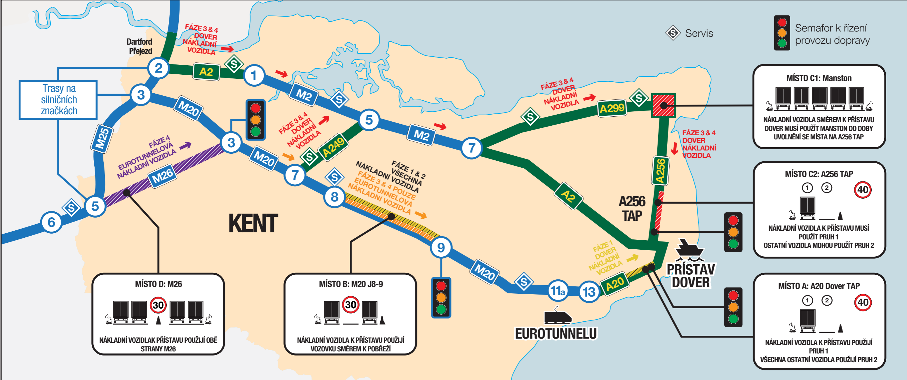
● Mapa pokynů pro nákladní vozidla mířící do Evropy cestující k Eurotunnelu nebo přístavu Dover na pobřeží v Kentu. ●